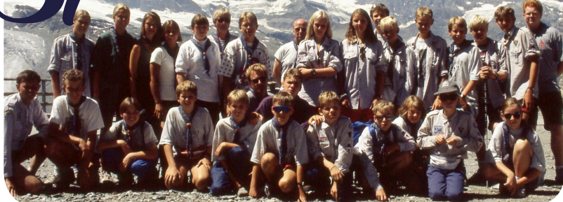
Speidertur til Sveits i 1994