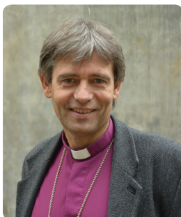
Av Biskop i Agder og Telemark Stein Reinertsen