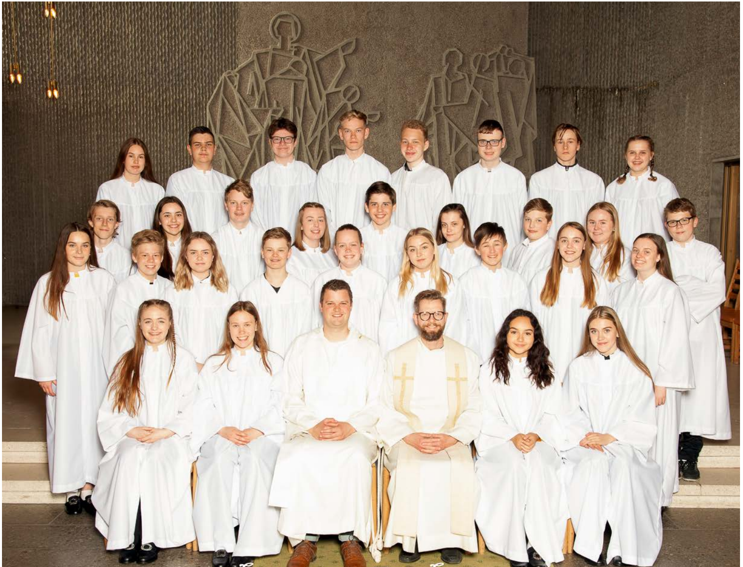
Konfirmanter i Grim kirke 2018