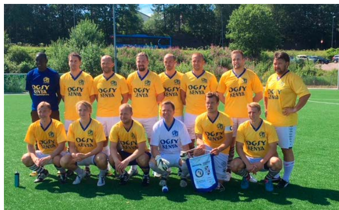
Vennskapskamp - Gamle Vigørhelter stilte i OGSY-drakta mot Vigør

et barn er rekruttert inn, følger gjerne familien med. Jentene spiller fotball i hovedserien og har vunnet mange ganger. Og forpliktelsen på fotballfronten er at de skal trene et annet lag. På den måten gir de noe tilbake til organisasjonen. De jentene som startet opp laget, var ikke helt unge, men de var slett ikke dårlige! Slik kom navnet OGSY frem: en honnør til dem: Old is Gold, Slum Youth. Hovedfokuset er at de skal ha det bra i livet sitt og gjøre sitt beste. I dag er det både jente- og guttelag i OGSY.