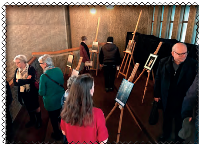
Galleri på Galleriet med seks fotografier av kunstneren Silje Ege.