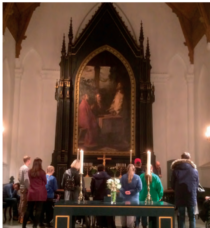
Her studerer ALF-klubbens medlemmer det store alterbildet i Domkirken.

Det var lagt opp et flott program fra Domkirkens side. Frivillig