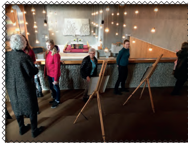
Oppe på galleriet kan besøkende også nye utsikten over det vakre kirkerommet i Grim kirke