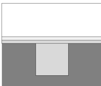
Skisse nåværende podiet